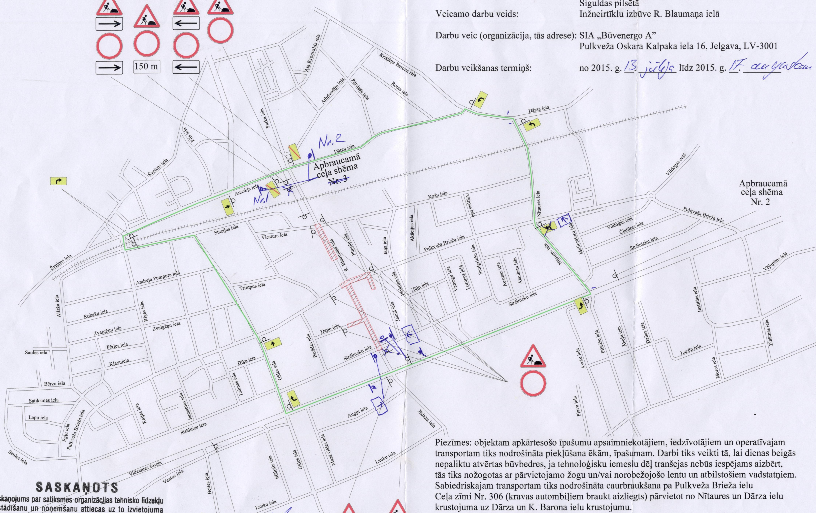
Apbraucamā ceļa shēma Nr. 2

no 2015. g. 13. jūlijs līdz 2015. g. 17. augustam